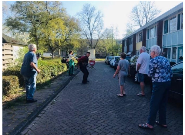
DAT!bandje tijdens lockdown in Tuindorp-Nieuwendam en de Banne, Amsterdam-Noord 2021