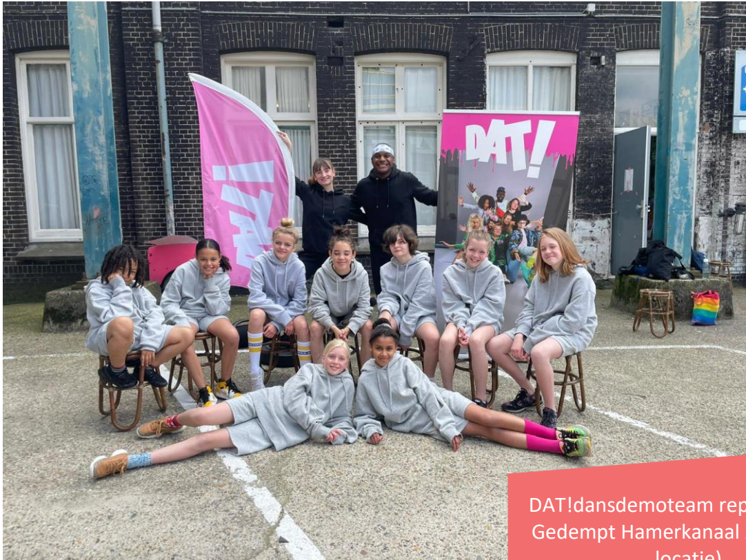
DAT!dansdemoteam repeterend op Gedempt Hamerkanaal 205 (vorige locatie)