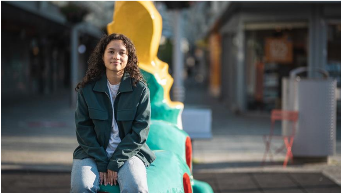
Er was eens in Noord...het verborgen verhaal van Tessa

De cursus werd afgesloten met een fashionshow, gepresenteerd aan ouders/verzorgers en opa's en oma's. Helaas hebben we buurtbewoners en overige familieleden niet kunnen uitnodigen vanwege de maatregelen. Een intieme setting met een rode loper in de prachtige tuin waarin de leerlingen hun eigen ontworpen kostuum toonden. De leerlingen waren zowel kostuumontwerper als model als danser. Geheel in lijn van de multidisciplinaire visie van de DAT!school.