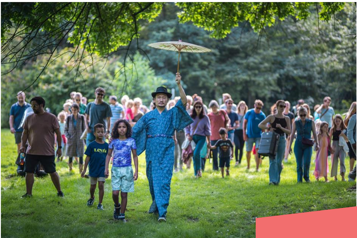
Deelnemers en publiek locatievoorstelling Legacy in het Noorderpark, augustus 2021