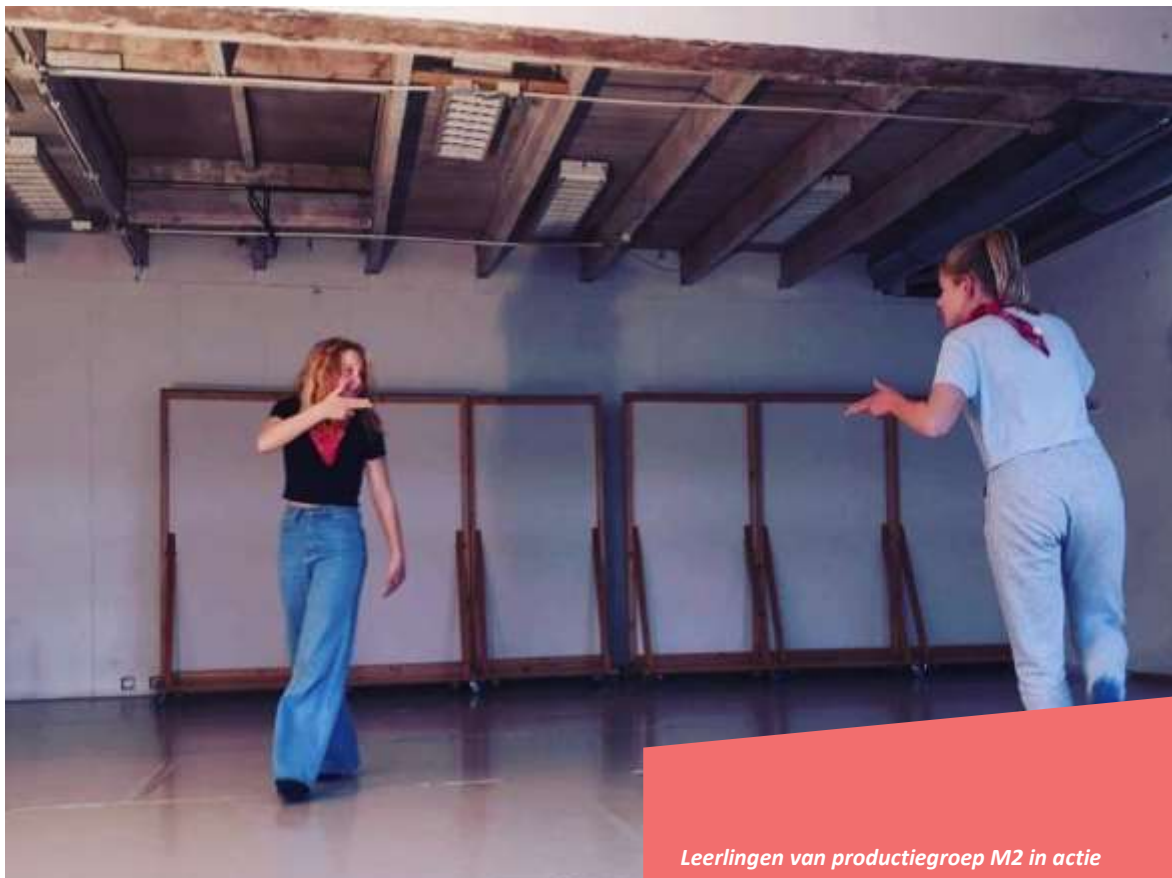
Leerlingen van productiegroep M2 in actie

De DAT!school heeft zich het afgelopen jaar, ondanks en ook dankzij Covid-19, kunnen verdiepen in elkaar, de leerlijn en de leerlingen. Er was ruimte voor extra pedagogische vaardigheden vanuit docenten en de gastheer/-vrouwen van de DAT!school door individuele gesprekken te voeren met de leerlingen. Deze één-op-één aandacht heeft zijn vruchten afgeworpen. Kinderen voelden zich meer gezien en gehoord, de betrokkenheid van ouders/verzorgers is geïntensiveerd en zorgt voor meer begrip op (thuis)situaties en de sociale en emotionele ontwikkeling van de leerlingen. Er hebben meer teamoverleggen plaatsgevonden, al dan niet via ZOOM.