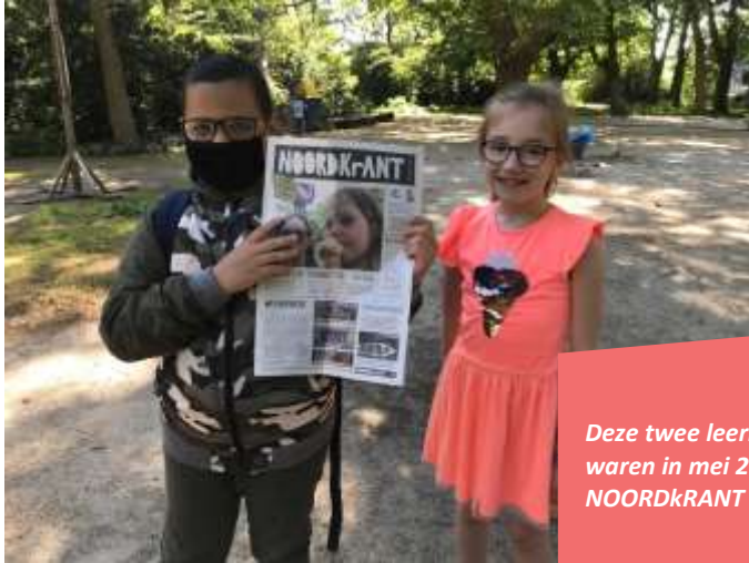
Deze twee leerlingen van de DAT!school waren in mei 2020 reporter van de NOORDkrANT

In samenwerking met de Tolhuistuin en Into The Great Wide Open organiseerden wij in mei 2020 de NOORDKrANT. De redactie van deze eenmalige krant bestond uit 16 jonge reporters (waaronder DAT!school-leerlingen) die hard hebben gewerkt aan mooie nieuwtjes, persoonlijke verhalen, interviews en fotoreportages over het leven in Amsterdam-Noord ten tijde van Corona. De krant kwam uit op 19 mei 2020 en werd verspreid onder Noordse huishoudens.