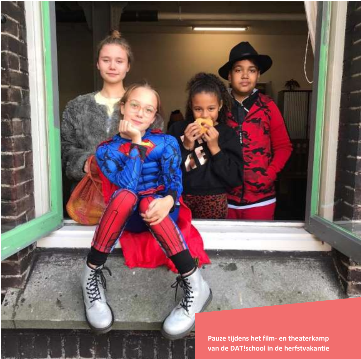
Pauze tijdens het film- en theaterkamp van de DAT!school in de herfstvakantie