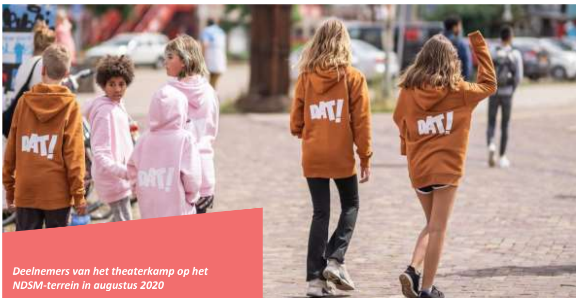
Deelnemers van het theaterkamp op het NDSM-terrein in augustus 2020