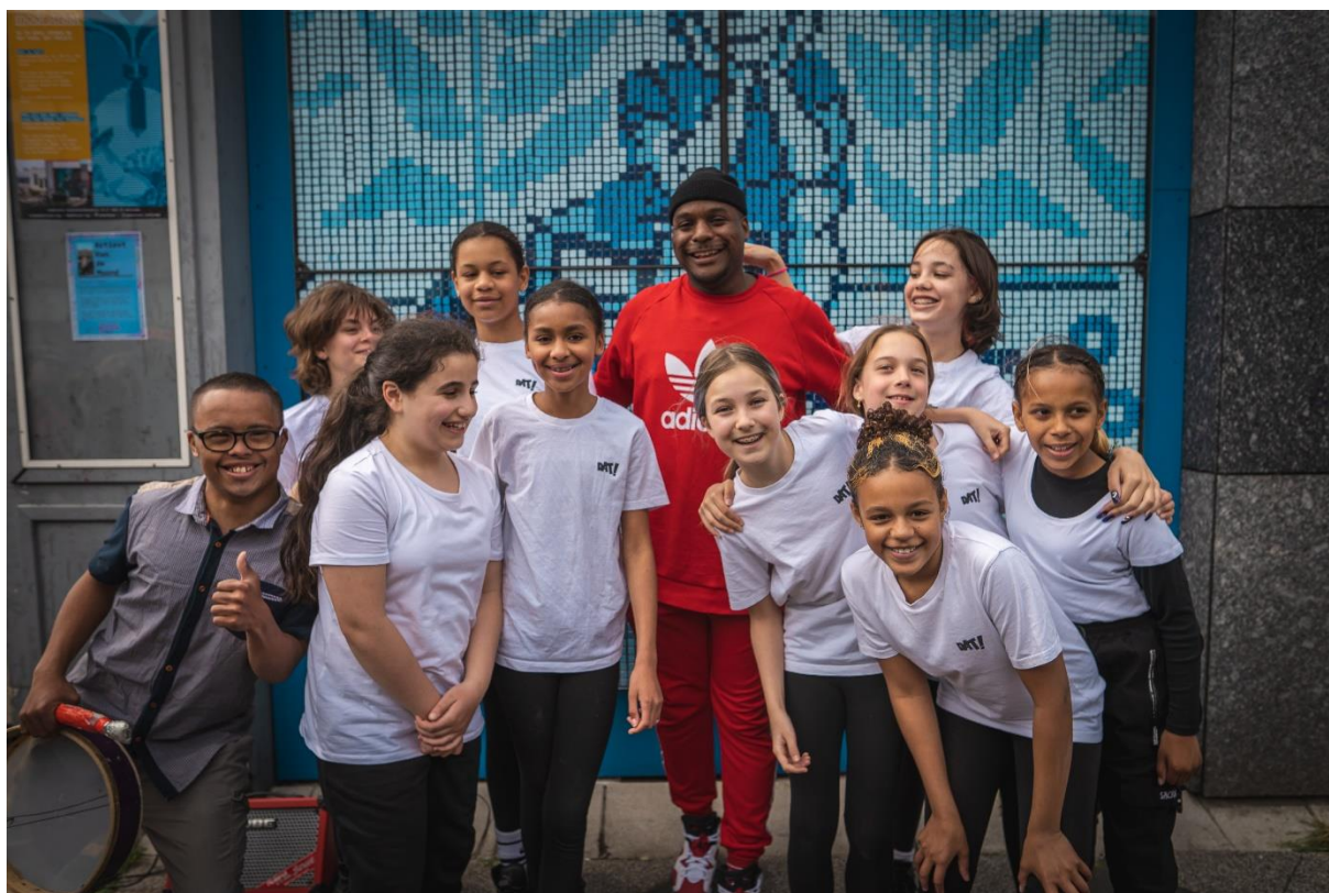
Pixel Community Art ism de Modestraat & Dansdemo team

Vanuit de leerlijn, is er inmiddels ook een Dans Demoteam ontstaan. Een groepje leerlingen, dat excelleert in dans choreografieën en optredens verzorgt in Amsterdam-Noord.