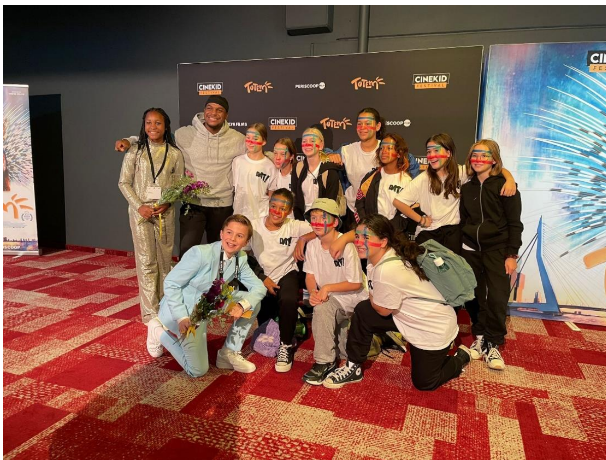
Dans Demoteam bij de première van 'Totem' tijdens de opening van het Cinekid Festival, 2022

Gezien de coronapandemie voor de meeste mensen in 2022 voorbij was, zijn de publieksaantallen bij de DAT!school enorm gestegen ten opzichte van 2021. Dit heeft met name te maken met deelname aan de Volksopera op het Purmerplein en het Cinekid Festival, in de vorm van optredens voor een groot publiek en workshops voor alle bezoekers van het festival. Het Dans Demoteam won aan populariteit en werd steeds regelmatig gevraagd voor optredens.