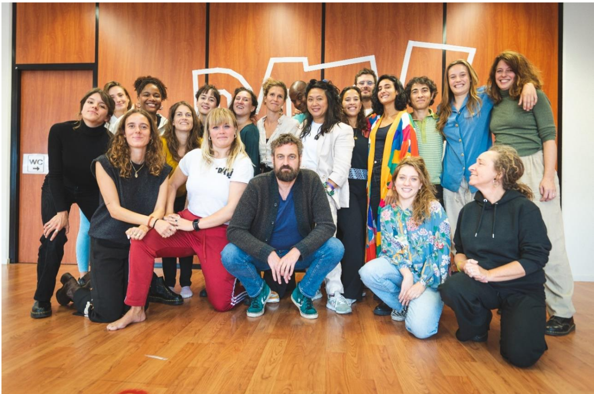
DAT!team waaronder docenten, personeel, stagiaires en vrijwilligers

De leidraad bij de manier waarop wij omgaan met onze directe effecten op het kind, de ander, de samenleving, de natuur en het klimaat. Alles is met elkaar verbonden en wat je zegt ben je zelf. Wij reflecteren graag op de kinderlijke wijsheid.