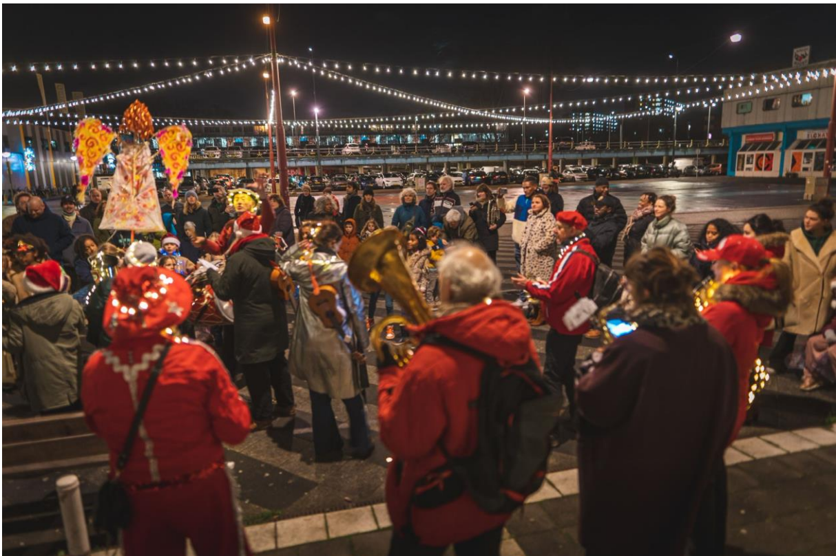
DAT!kerstkoor © Michel de Wit, 2022

Noordeling: 'Hartstikke mooi wat jullie doen voor de kinderen en de buurt. Gewoon doorgaan met wat jullie doen hoor!'