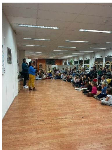
Kerstpresentaties kernlessen, 2022