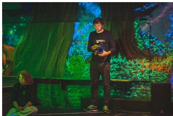
DOCK & DATpodium in de Valk